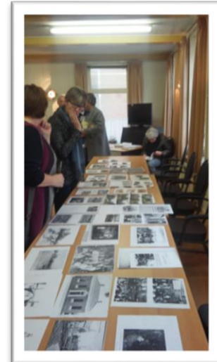
Foto- en filmmiddag Dorpshuis Pieterburen. In het najaar organiseerden we in het dorpshuis van Pieterburen ook een foto- en filmmiddag. In samenwerking met Rienk Dijkstra (Facebook pagina Pieterburen Vrouger) stelden we een mooi programma samen wat bij het publiek zeer werd gewaardeerd. Ruim 50 belangstellenden kwamen er op af en het leverde ons tevens 4 nieuwe donateurs op.