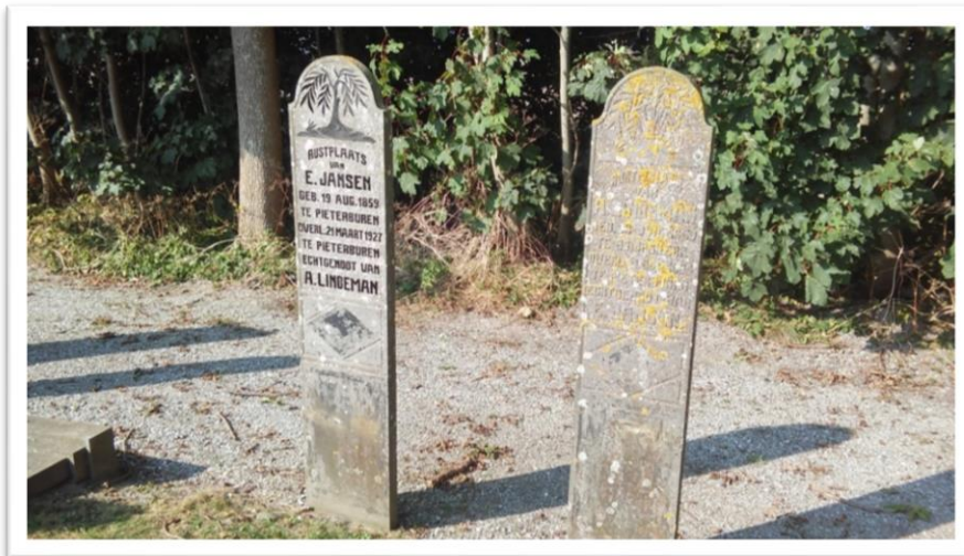
rechts een door algen aangetaste grafzerk, links het resultaat na het schoonmaken en verven

Begraafplaats Pieterburen. In 2016 kregen we hulp van een paar inwoners uit het dorp, zodat we toch de herstelwerkzaamheden konden hervatten. In 2017 stonden de werkzaamheden, mede door het vaak slechte weer, op een laag pitje.