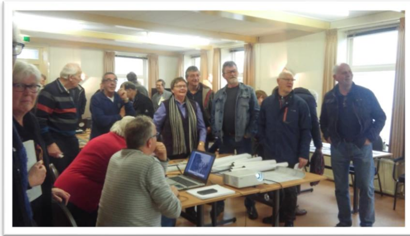
Foto- en filmmiddag Dorpshuis Eenrum. In maart organiseerden we een middag, met als doel ons fotoarchief completer te maken. Op een groot scherm lieten we foto's zien waarop voor ons onbekende personen stonden of van bepaalde gebeurtenissen. Daarnaast vroegen we het publiek ook zelf foto's in te brengen. Men kon de foto's afstaan aan de historische kring of ter plekke laten digitaliseren. Het werd vooral een gezellige middag en af en toe ontstond er discussie over wie of wat er op de foto's was te zien. Uiteindelijk leverde deze middag aanvullende informatie en nieuwe foto's op.