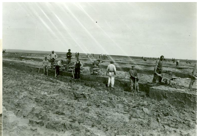
Aanleg Linthorst Homanpolder 1939