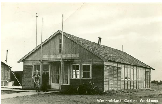
Kantine werkkamp De Slikken