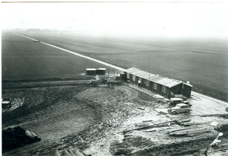
Werkkamp De Slikken, Linthorst Homanpolder Westernieland, rond 1938