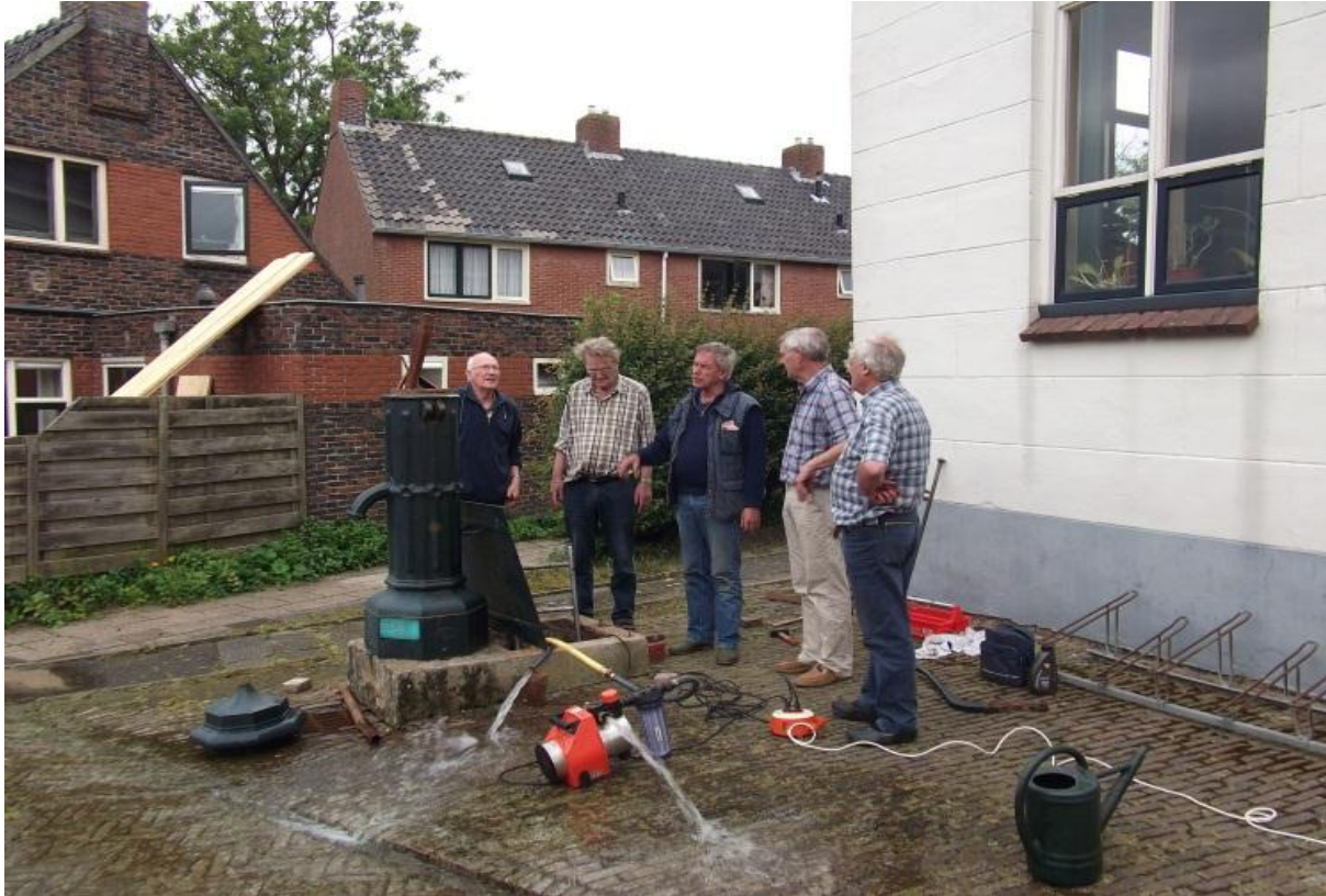
De werkzaamheden aan de dorpspomp in volle gang.